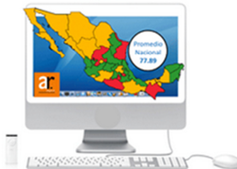
Nivel de Transparencia Fiscal, ITDIF 2021

ITDIF: Índice de Transparencia y Disponibilidad de la Información Fiscal de las Entidades Federativas